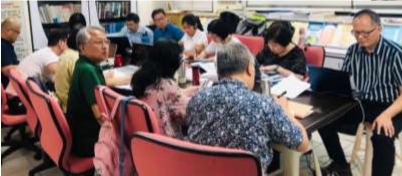
← ▽ ▲ 講師授課及學員上課情形